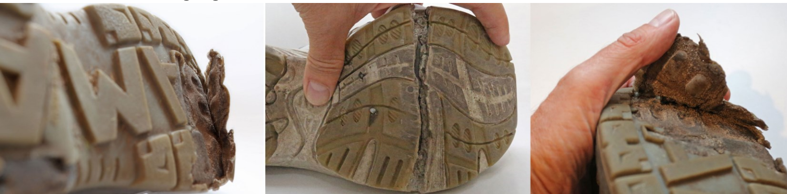
↑ Risse, Materiallösung – irreparabel beschädigt