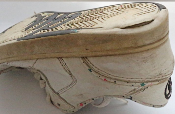
← durchgelaufen/durchgetragen – teilweise aufgelöstes und gerissenes Material